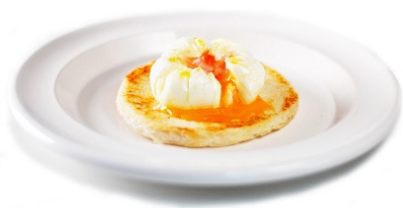
Huevo Poché 50g

Sumerja los huevos en un baño tibio (40-45 ° C) durante 4-5 minutos. Uso previsto: calentar y consumir sólo o acompañado de guarnición, según gusto del consumidor.