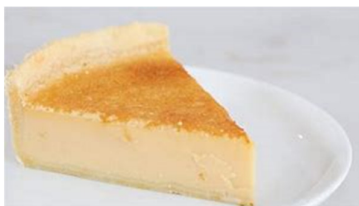
Pastel de Huevo Dulce 100gr

Uso previsto: calentar y consumir sólo o acompañado de guarnición, según gusto del consumidor.