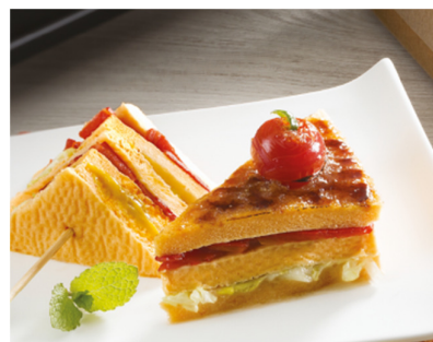
Sugerencia de Presentación